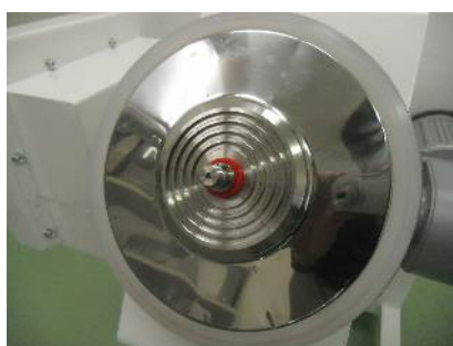
ラビリンス構造により軸への 原料侵入を防止します