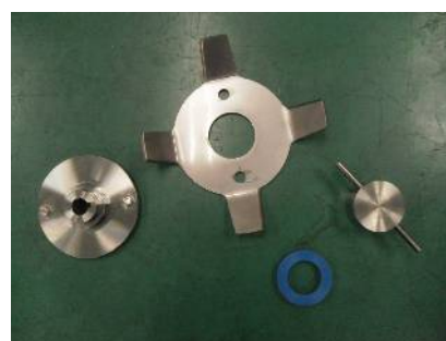
チョッパー部は分解洗浄が可能 パーツ毎の単品発注も承ります